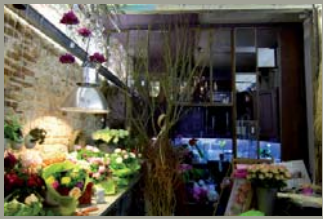
Boutique atelier après la pluie 7, Place de la République à Orléans

Conception et réalisation de ce lieu avec le scénographe Christophe Moreau